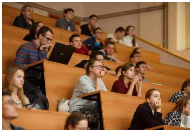
Московский физико-технический институт