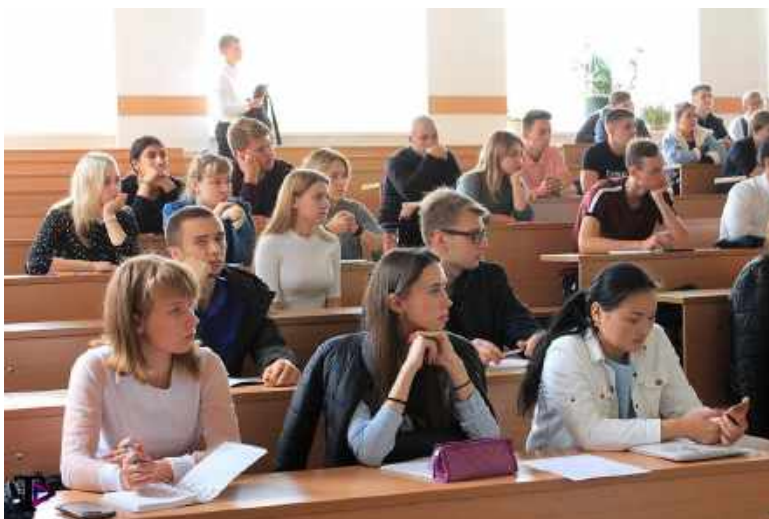
Новосибирский государственный аграрный университет