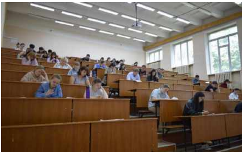
Новосибирский государственный педагогический университет