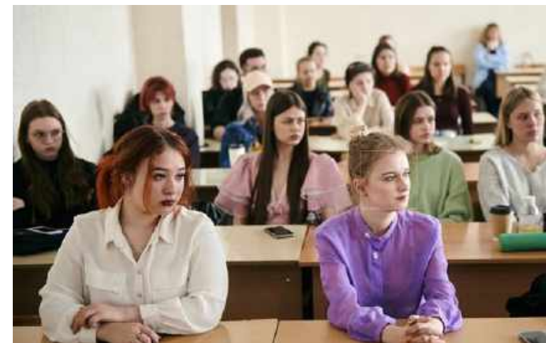
Новосибирский государственный университет архитектуры, дизайна и искусств им. А.Д. Крячкова