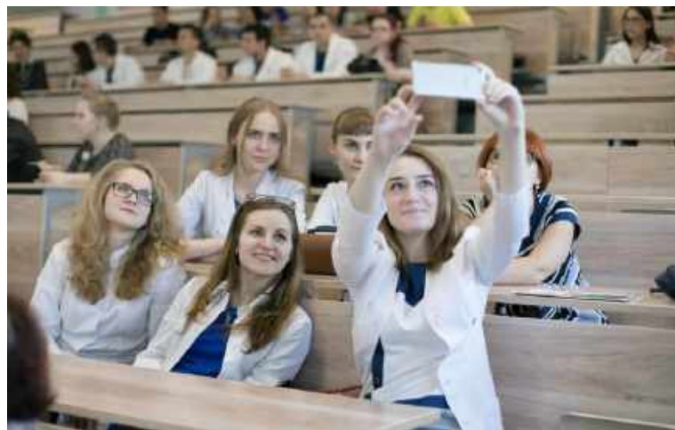
Новосибирский государственный медицинский университет