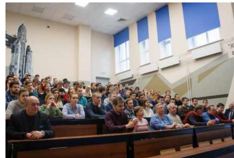
Московский авиационный институт